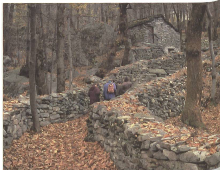
Die historischen Verkehrswege in der Piottino-Schlucht TI und bei Piuro im Bergell GR