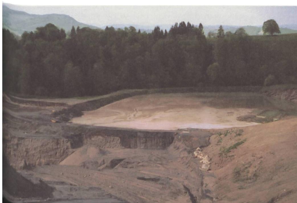
Blick auf das Kiesabbaugebiet Bethlehem mit dem Schlammweiher

Le point positif est que le gouvernement zougnois a (enfin) stipulé, dans l'autorisation délivrée, que l'extraction de gravier dans le paysage morainique était aussi exclue à long terme. Nous espérons que ce principe, qui a été repris dans le projet de plan directeur cantonal, ne sera pas édulcoré par les autorités politiques. La solution négociée donne un signal fort au-delà des frontières cantonales et démontre que, dans le domaine de l'extraction de gravier, il est possible de parvenir à un résultat satisfaisant grâce à la volonté de dialogue des organisations écologiques et des requérants. L'avenir nous dira si ce résultat aura une incidence sur l'examen, par le Tribunal administratif zougnois, du