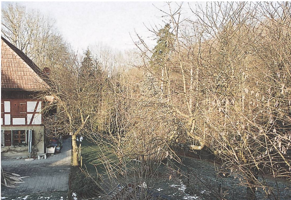
Geplanter Leistungsverlauf (Galmiz–Villarepos) im Burggraben bei Murten FR