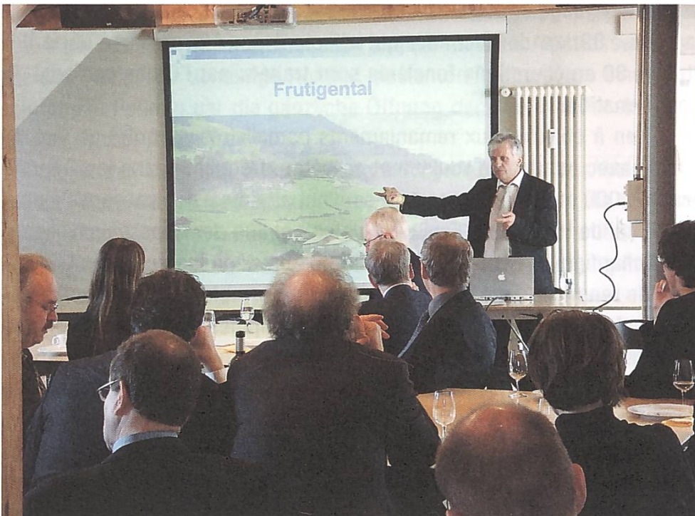
Impressionen von einem Parlamen- tarieranlass