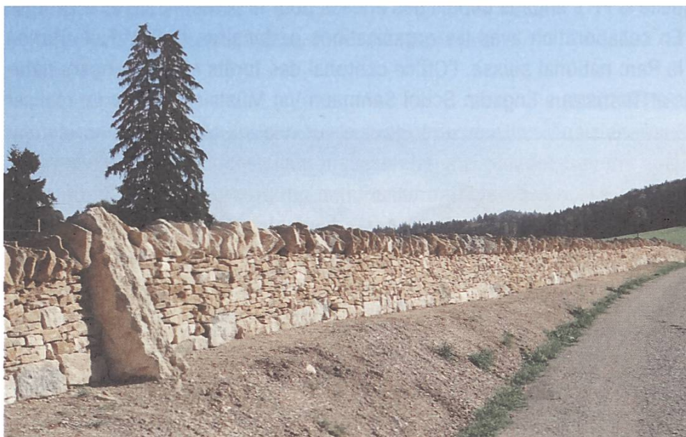
Die wiederhergestellte Trockenmauer von Muriaux BE

Trockenmauern sind ein wichtiger Bestandteil der Waldweidelandschaften des Juras, ihre Instandstellung wurde aber in den letzten Jahrzehnten oft vernachlässigt. Um dieses historische und landschaftsprägende Kulturgut zu erhalten, trägt die SL zur Förderung des Wissens und der Techniken des Trockenmauerbaus bei und unterstützt Initiativen zum Erhalt der Trockenmauern. Im Ort «Derrière la Tranchée» in der Gemeinde Muriaux BE hat die SL ein Projekt zur Instandstellung eines Trockenmauerabschnittes von mehreren Hundert Metern lanciert. Die Mauer verläuft entlang einer Waldweide und wird zusammen mit einer Baumallee einen wichtigen Bestandteil der Aufwertung eines historischen Verkehrswegs (IVS) von 2,5 Kilometern Länge darstellen. Zwischen 2009 und 2011 wurden mithilfe lokaler Mauerbauer bereits mehr als 400 Meter Mauer nach Originalmethoden instand gestellt, eine Arbeit, die von den Spaziergängern sehr geschätzt wird und die es auch erlaubt, sich ein Bild der zukünftigen Restaurierung weiterer Mauerabschnitte zu machen.