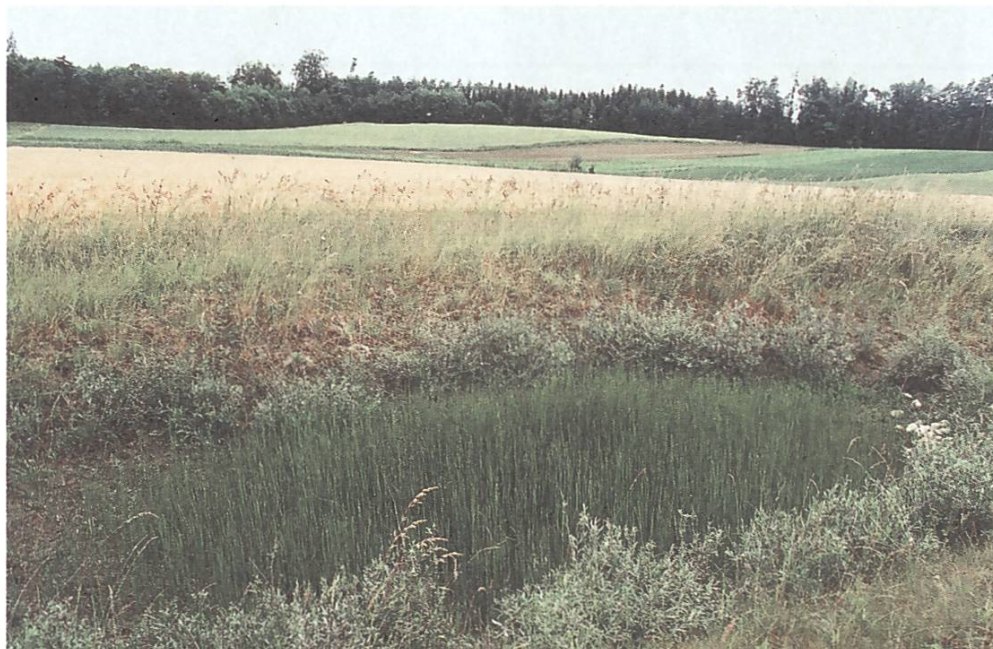
Neue Naturvielfalt auf dem Ulmizer Plateau FR

Der Deutschfreiburger Landschaftspreis ist ein wichtiger Motor der breiten Sensibilisierung und wurde daher auch Vorbild für die Auszeichnung «Landschaft des Jahres» der SL.