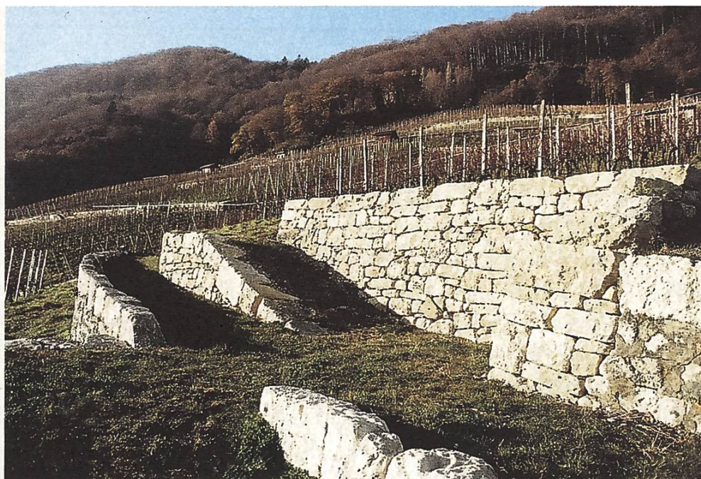
Les nouveaux murs de pierres sèches près de l'église de Gléresse

tionale, ces nouveaux murs permettent aussi d'accéder plus facilement aux parcelles viticoles et de mieux les exploiter. Le projet comprend environ 1000 m 2 de murs et est probablement le plus important de ce genre en Suisse actuellement. Le coût total s'élève à quelque 2 millions de francs.