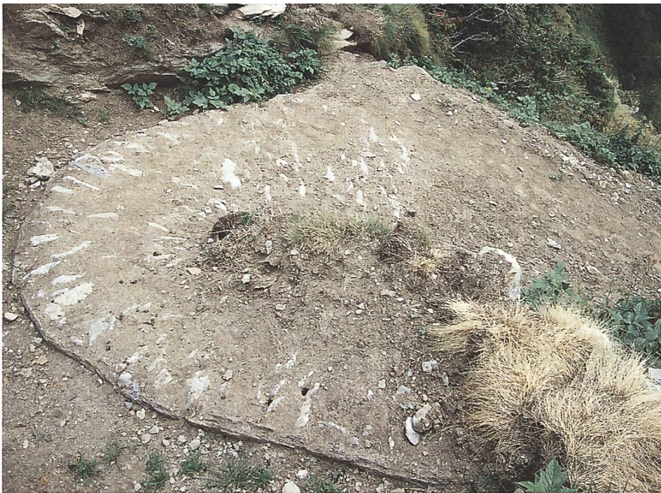
Hangerechte Sanierung des Erilweges mit Steinbicki