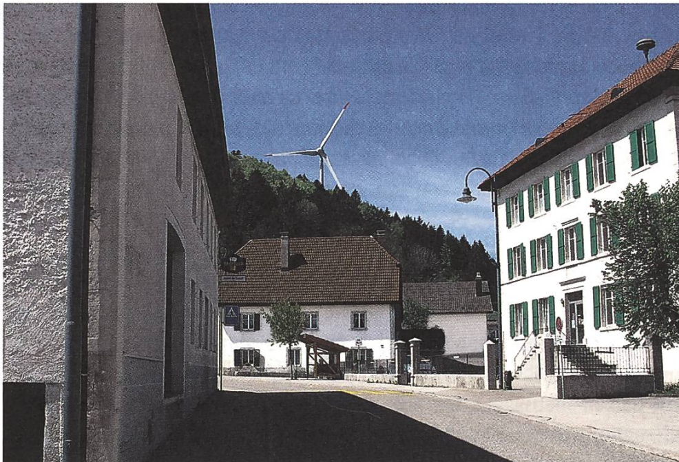
Die Windkraftanlage in St. Brais JU ist vom Ort gut sichtbar

Das Ziel der Studie war es, Sichtbarkeitsanalysen aus Sicht der betroffenen Einwohnerinnen und Einwohner zu erstellen. Sichtbarkeitsanalysen werden in der Regel nur für den geplanten Windpark berechnet. Der Effekt benachbarter Windparks wird dabei oft nicht berücksichtigt. In dieser Studie wurde eine kumulierte Sichtbarkeitsberechnung geplanter Windparks im Kanton Waadt und in Teilen des Kantons Neuenburg durchgeführt (174 Anlagen in Planung), um eine Gesamtsicht der potenziellen Auswirkungen auf die Bevölkerung zu erhalten. Basis sind die in den kantonalen Richtplänen aufgeführten Planungsgebiete für Windenergieanlagen.