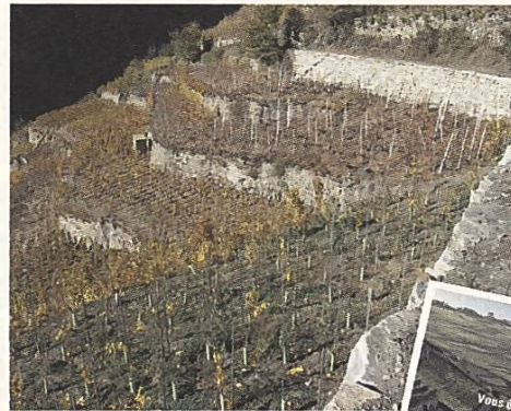
Le vignoble en terrasses de Visperterminen.

Pourtant, ce monde idéalisé par le poète Rainer Maria Rilke, l'écrivain C.F. Ramuz ou le peintre Oskar Kokoschka pourrait bien se retrouver en danger de disparition.