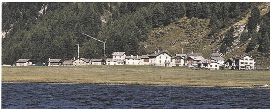
Idyllisch gelegenes Isola: Die Stiftung für Landschaftsschutz Schweiz ruft in einer nationalen Aktion zur Rettung des Bijou auf.