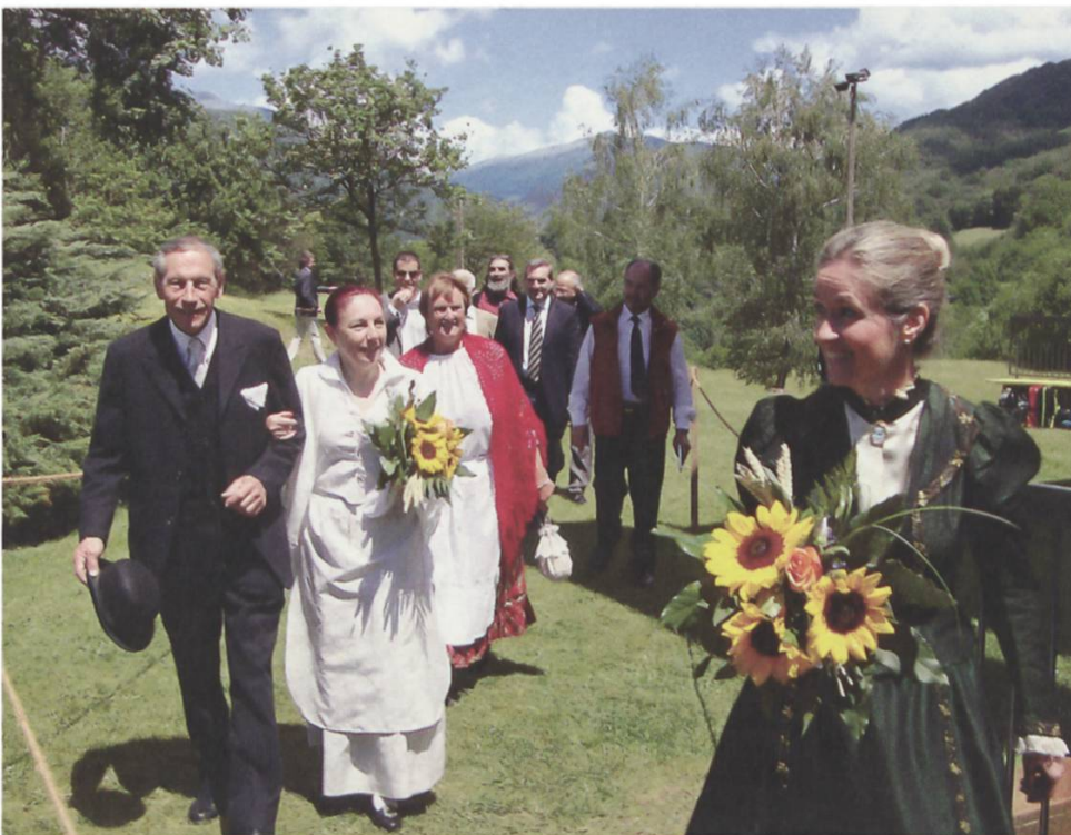
Festakt der Preisübergabe «Landschaft des Jahres» 2014 – Valle di Muggio TI

Der Preisträger 2014 ist das in der übrigen Schweiz erstaunlich wenig bekannte Valle di Muggio, ein 37 km 2 grosses Seitental des Mendrisiotto. Es wurde von Karl Victor von Bonstetten 1797 als «eines der schönsten Alpenthäler, das ich je gesehen» bezeichnet. Es ist das