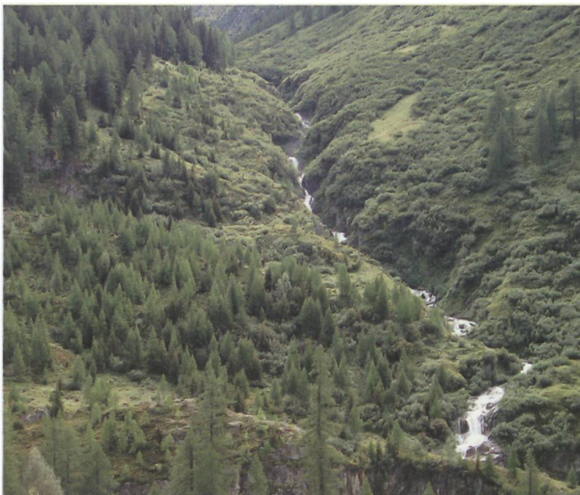
Bild links: Die Kaskaden des Gonerliwassers konnten gerettet werden!

Die Kostendeckende Einspeisevergütung (KEV) des Bundes deckt für 20 bis 25 Jahre die Differenz zwischen Produktion und Marktpreis und garantiert den Produzenten von erneuerbarem Strom einen Preis, der ihren Produktionskosten entspricht. Gespeist wird der KEV-Fonds von allen Strombezügern, die pro verbrauchte Kilowattstunde eine Abgabe bezahlen. Dieser Sub-