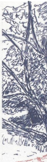
Nouveaux murs en pierres sèches (avant/esquisse/ après)

Die Umsetzung des 2016 gestarteten Programms wird von einer breit abgestützten Fachkommission unter der Leitung der SL getragen. Die Massnahmen betten sich ein in drei identifizierte Teilraumästhetiken («Das Arkadische», «Das Pittoreske», «Das Klösterlich-Romantische»). Diese Teilräume sind durch verbindende Sichtbezüge charakterisiert. Sechs markante Aussichtspunkte werden in Erinnerung an die letzten sechs Nonnen, die vor genau 600 Jahren das Kloster verlassen mussten, mit je unterschiedlichen Einzelbäumen markiert und über einen künftigen Landschaftsweg miteinander verbunden. Schönthal entwickelt sich nun zu einem Modell des Zusammenwirkens von Ästhetik, Landwirtschaft und Biodiversität. Vielleicht ist dies gar eine Art «Weltmodell», wie ein Miteinander von Mensch und Natur, Wirtschaften und Kunst aussehen könnte. Die erste Etappe wurde von vielen Partnern (unter anderem dem Fonds Landschaft Schweiz und verschiedenen Stiftungen) breit unterstützt und findet ihren Abschluss 2019. Bereits sind die neuen Akzente in der Landschaft sichtbar, und der Ort entwickelt sich nebst dem herausragenden Skulpturenpark auch zu einem kleinen Mekka für Landschafts- und Biodiversitätsinteressierte.