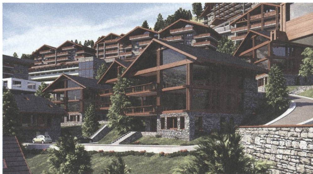
Chalets am Laufmeter in Aminona VS

Diese massentouristischen Vorhaben bedeuten nicht nur eine grosse Belastung für die Umwelt, sondern auch für das Landschafts- und Ortsbild. Auf der anderen Seite stehen nach wie vor