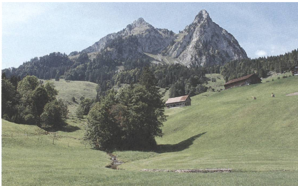
Der kleine Mythen aus nördlicher Rich- tung fotografiert