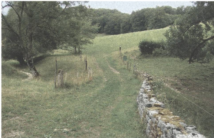
Neue Trockenmauern (vorher/Handskizze/nachher)

Das ehemalige Kloster Schönthal in Langenbruck BL ist ein gelungenes Beispiel einer parallelen Entwicklung von Kulturlandschaft und Biodiversität, und zwar unter Einbezug der Landwirtschaft und der Kunst. 2015 entstand die Vision, den neuen, 100 Hektaren grossen Demeterbetrieb auf die Ziele der Biodiversität und der Landschaftsästhetik auszurichten. Als Grundlage ist ein Programm «Entwicklung Kulturlandschaft Kloster Schönthal» unter der Obhut der Eigentümerin, der Stiftung Sculpture at Schoenthal, erarbeitet worden. Basis dafür waren ein Konzept der SL zur Förderung der Landschaftsästhetik, ein Konzept zu den Kraftorten sowie eines des Forschungsinstituts für biologischen Landbau (FiBL) zur biologischen Vielfalt. Auch Pro Natura BL und BirdLife Schweiz trugen zusätzliche Ideen zur Aufwertung der Landschaft bei. Das daraus abgeleitete Programm umfasst betriebliche Massnahmen (z.B. Reduktion des Nährstoffeintrages), Unterhalts- und Pflegemassnahmen (z.B. Förderung von Krautsäumen und Altgrasstreifen), bauliche Massnahmen (z.B. Ausdolungen, Weihersanierung, Holzzäune, Trockenmauern), Pflanzungen und forstliche Massnahmen (z.B. Entwicklung lichter Waldstandorte).