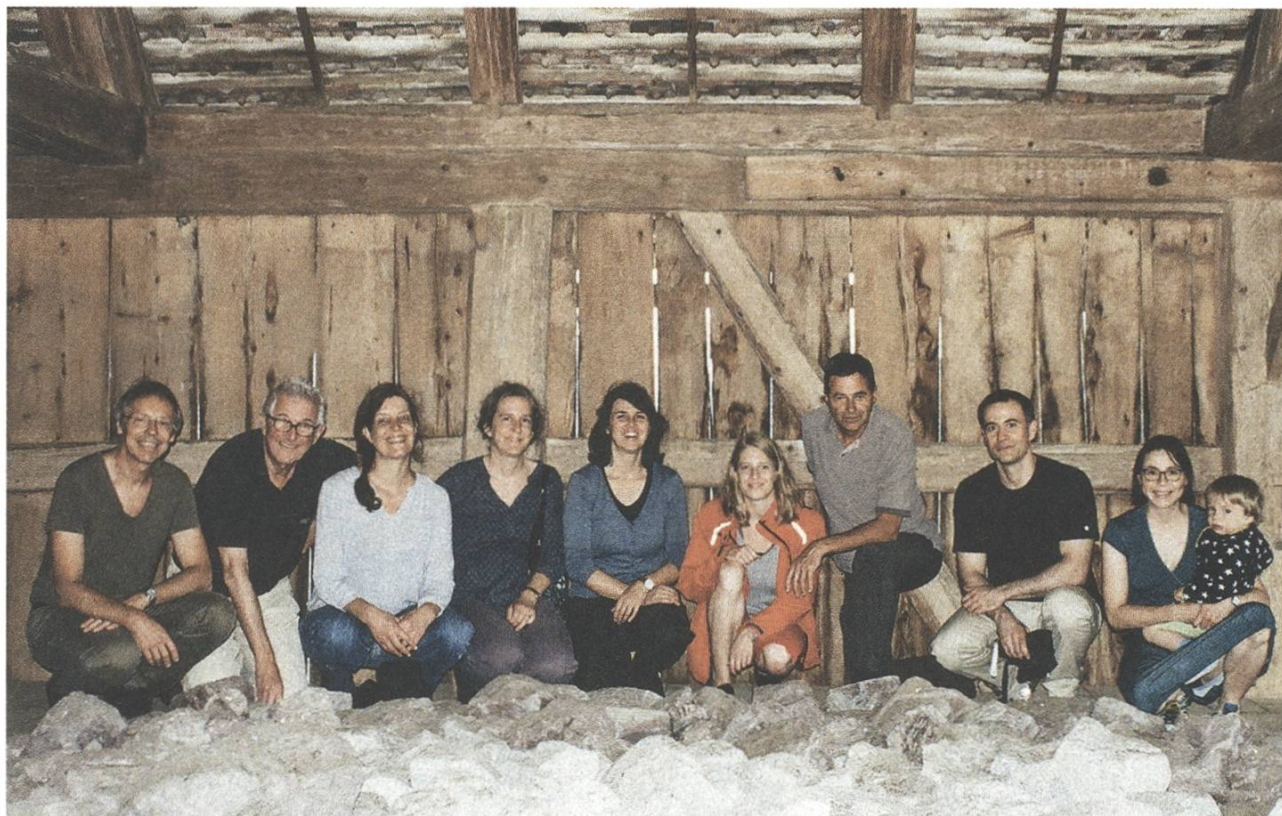
Das Team der SL. L'équipe de la FP.

Le travail accompli par le secrétariat en 2018 se répartit entre les champs d'activité indiqués sur le graphique en page 88.