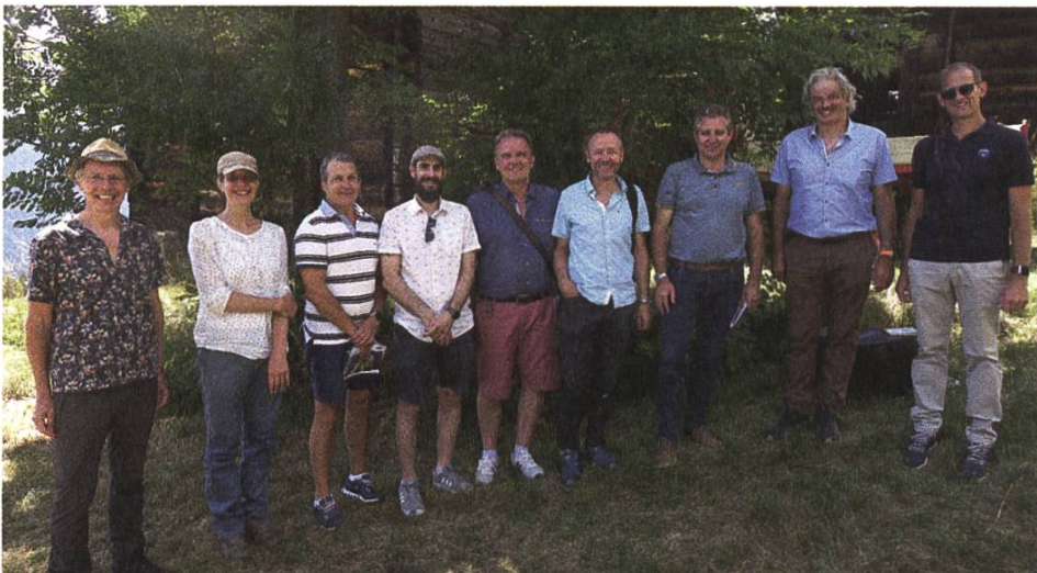
Gründungsversammlung «Fachkommission Bewässerungslandschaft Oberwalliser Sonnenberge»

Ernährungsgrundlage, Strukturvielfalt, Biodiversität, Ästhetik, Raum für Erholung: Bewässerungslandschaften leisten viel und verfügen über eine Vielzahl von Qualitäten. Gleichzeitig ist die traditionelle Bewässerung, wie sie in der Schweiz aktuell noch im Wallis (Wässerwasserleiten/Suonen und traditionelle Hangberieselung) oder im Oberaargau (Wässermatten) betrieben wird, auch ein Teil der regionalen Geschichte und Identität. Hinsichtlich des Ziels, traditionell bewässerte Regionen in der Schweiz, in Belgien, in den Niederlanden, in Deutschland, Luxemburg und Österreich für die repräsentative Liste des immateriellen Kulturerbes der Unesco vorzuschlagen, sind wir in der Schweiz einen Schritt weitergekommen: die Wässermatten Oberaargau und die Geteilschaften des Wallis sind bereits seit längerer Zeit auf der «Liste der lebendigen Traditionen in der Schweiz» aufgeführt, die Wässermattenstiftung existiert schon seit 1992,