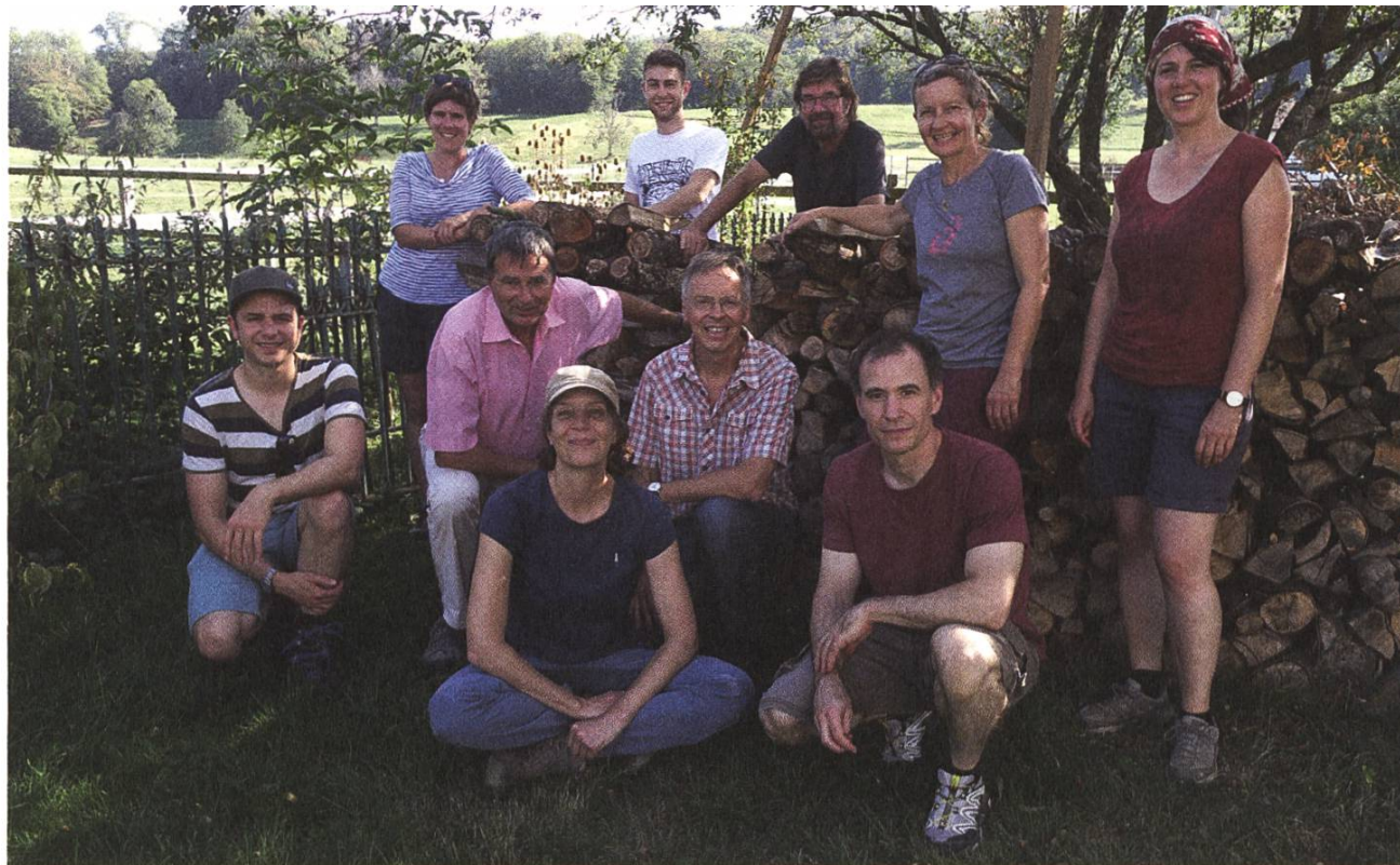
Das Team der SL-FP. L'équipe de la SL-FP.