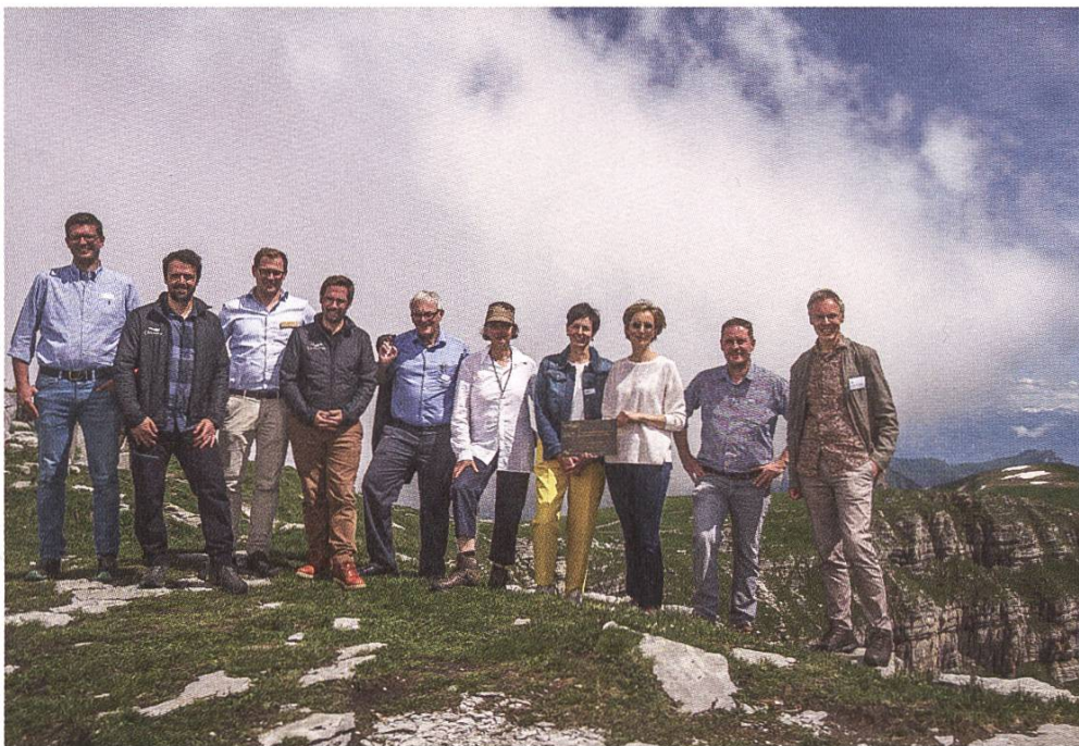
Vertreterinnen und Vertreter der Toggenburg Bergbahnen am Festakt vom 10. Juli 2021

Seit ihrer strategischen Neuausrichtung im Jahre 2015 fokussierte sich die Toggenburg Bergbahnen AG bei der touristischen Entwicklung auf einen nachhaltigen Umgang mit der Landschaft, eine von Ästhetik und regionaler Bauweise inspirierte Infrastruktur sowie die Stärkung