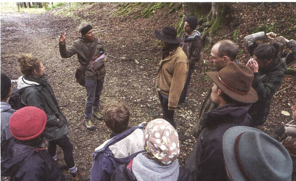
Kurstag mit Landwirtschaftsstudierenden im Schönthal

Die Bildungsarbeit und die wissenschaftlichen Tätigkeiten sind ein wichtiger Akzent der SL-FP. So findet die Themenliste für studentische Abschlussarbeiten regen Zuspruch und führt jährlich zu einem halben Dutzend betreuten Arbeiten. Darüber hinaus übernimmt die SL-FP auch eigene wissenschaftliche Studien, wovon einige im Jahr 2021 weitgehend abgeschlossen werden konnten: Neues Gemeinwerk, Quellen, Tranquillity Map. Schliesslich konnten im Jahr 2021 die Vorarbeiten für den neuen Ausbildungsgang der SL-FP «Ästhetische Landschaftsbewertung» ausgeführt werden. Dieser Kurs wird 2022 starten. Einen grossen Umfang nehmen inzwischen auch die Lehraufträge und Vorlesungen an den Hochschulen und Universitäten ein, die pandemiebedingt teilweise per Videokonferenz gehalten werden mussten. Der SL-FP-Geschäftsleiter führte 2021 die beiden Lehraufträge an der ETH Zürich (Master-Vorlesung «Landscape aesthetics»)