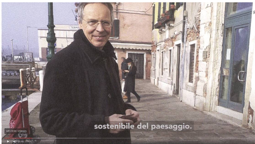
Szene aus dem Film «Sostenibilità»