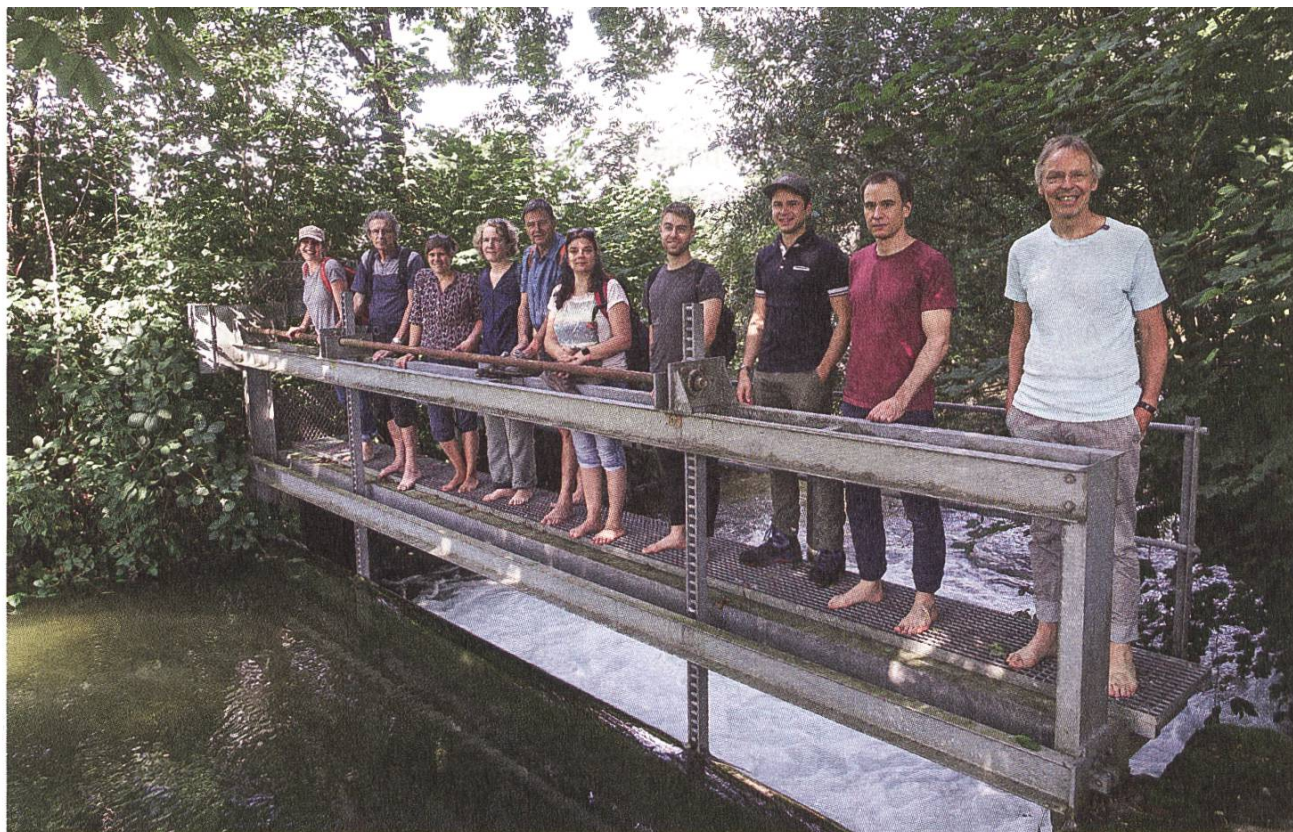
Das Team der SL-FP. L'équipe de la SL-FP. 88