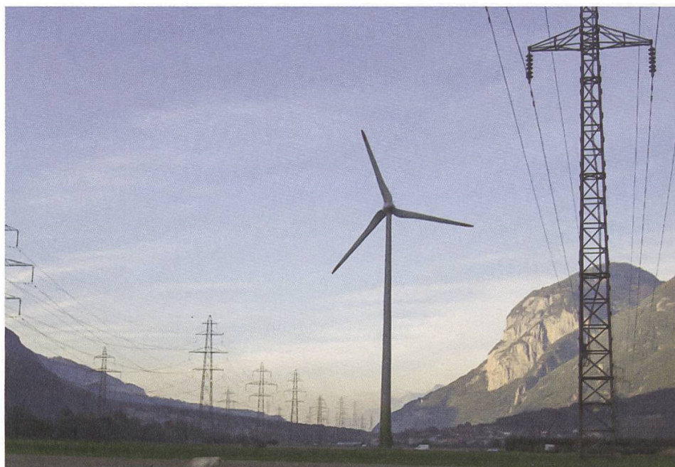
Windkraftanlage in Collonges VS nahe der Stromleitung

Die Landschaften der Schweiz stehen unter einem nie dagewesenen Veränderungsdruck. Hunderte von Windrädern werden in einigen Jahren viele Hügelkuppen und Bergkretzen «zieren». Freiflächen-PV-Anlagen und neue Speicherseen drängen in unerschlossene Landschaften. Eine fachlich sorgfältige Schutz- und Nutzungsplanung ist kaum erkennbar, da die Kantone und Projektbetreiber nun die gelockerten gesetzlichen Rahmenbedingungen ausnützen. Die SL-FP schlug nun als Lösungsansatz vor, in räumlichen Einheiten im Sinne von kombinierten Energieinfrastrukturlandschaften zu denken. Auch die Schweizerische Akademie der Naturwissenschaften argumentierte in diese Richtung.