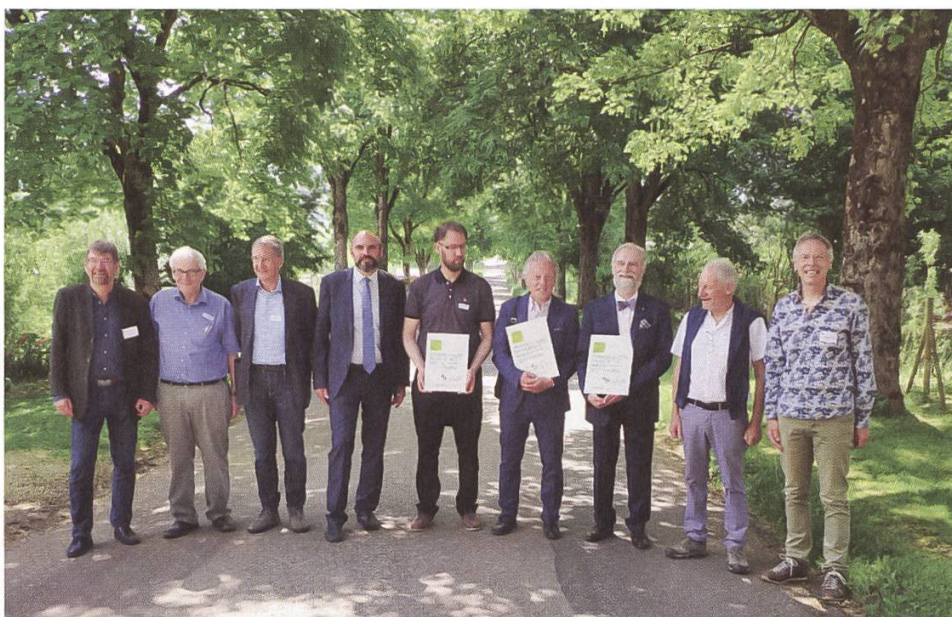
Preisübergabe Landschaft des Jahres 2022

Obwohl Baumalleen in der Schweiz nicht die gleiche historische Bedeutung haben wie in anderen europäischen Ländern, gibt es auch in unserem Land Regionen, in denen von Baumreihen