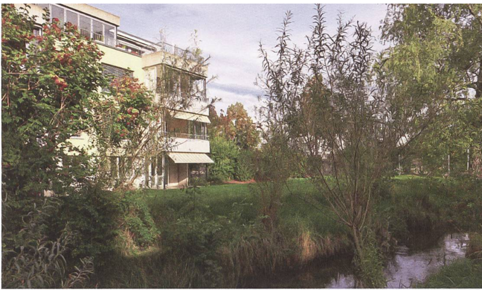
Attraktive Neubauquartiere bei den Giessen in Aarenähe, Münsingen BE