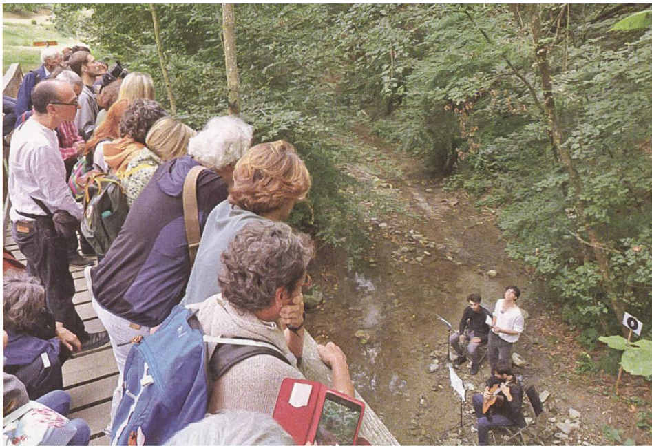
Schuberts Wanderinnen und Wanderer im Parco della Valle della Motta TI