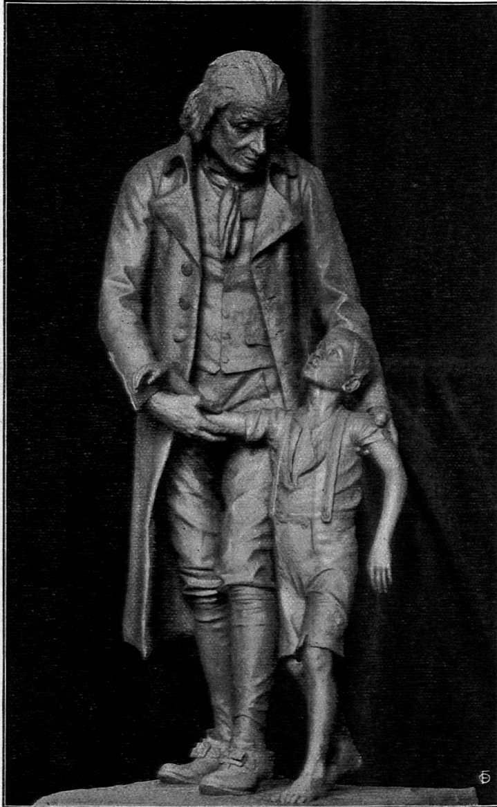
Das Pestalozzi-Denkmal in Zürich, eingeweiht 26. Oktober 1899.

Wie das Pestalozzianum selbst setzt es sich nicht bloss die Aufgabe, zu sammeln, sondern auch für den Zweck, dem es dienen soll, die Förderung der Pestalozzikunde, wissenschaftlich zu arbeiten. Seit 1880 gibt es sein Organ, die „Pestalozzblätter“, in jährlich 3—4 Nummern heraus; es hat neue Ausgaben von „Lienhard und Gertrud“, von Pestalozzis „Nachforschungen“ veröffentlicht (Verlag von F. Schulthess, Zürich), ferner eine Sammlung von Denksprüchen Pestalozzis, u. s. w.