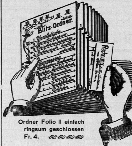
Ordner Folio II einfach ringsum geschlossen Fr. 4.—