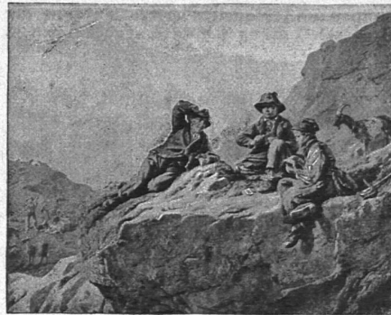
Spiel ohne Gewinn.

Zwei prachtvolle Gemälde (Format 54 x 66 cm), feinste Lichtdruckausführung, werden der schweizer. Lehrerschaft, sowie den werten Lesern der „Schweiz. Lehrerzeitung“ zum Preise von Fr. 3.75 beide Exemplare zusammen offeriert. Versand franko durch die ganze Schweiz. Zu beziehen vom Verlag Fritz Meyer, Buchhandlung, Zürich, Gessnerallee 38.