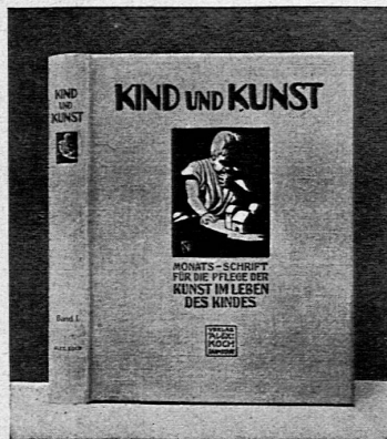
Weihnachts-Band 1905 eleg. geb. Mk. 14.—.