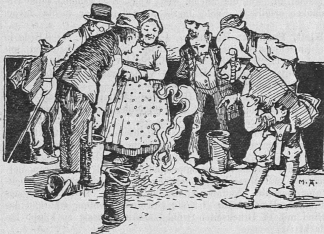
Aus „Freundliche Stimmen an Kinderherzen“, Verl.: Art. Institut Orell Füssli, Zürich.

Schon der Umstand, dass jede Erzählung dieser Sammlung sich dem abgesteckten Umfang eines Druckbogens anpassen muss, erweckt keinen hohen Begriff von dem Geiste des Unternehmens. Die Schablonenhaftigkeit erstreckt sich aber auch auf den Inhalt und die Tendenz der Erzählungen. Alle gehen darauf aus, an einer rührenden Geschichte, besonders an dem Schicksal eines vom Bösen zum Guten bekehrten Menschen, irgendeine fromme Lehre zu illustrieren. Das ist Kunst, wie sie die Leute von der inneren Mission verstehen;