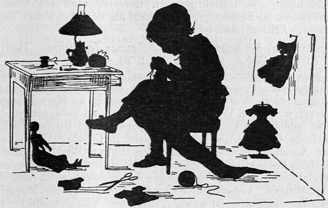
Aus „Freundliche Stimmen an Kinderherzen“.

Die sechs Erzählungen dieses Bandes offenbaren Lienerts Darstellungsgabe und Kenntnis seiner Landsleute aufs neue. Es brauchte eine geschickte Feder, um die kindliche Liebe des kleinen Anneli zu dem schwachsinnigen Balzli bis zum Kampf der gereiften Jungfrau gegen Eigennutz und Unrecht von Vater und Bräutigam zu steigern, wie dies in der ersten Erzählung geschieht, die dem Buch den Titel gegeben hat. Etwas von der ewig jungen List der Liebe gegenüber dem widerstrebenden Vaterwillen zeigt die Erzählung „Holüber“. Redlichkeit der Frau lässt den „Milchfälscher“ mit der Angst davon kommen; das ist köstlich erzählt. Von plastischer Wirkung ist die Erzählung von „Tönis Brautfahrt“ ins Welschland. Eine Kirchweih-Erfahrung spiegelt sich in der ergötzlichen Kindergeschichte: „Meine erste Liebe“, während „Klaudels Erbteil“ uns Schicksal und schliessliches Glück der treuen Katrina schildert. Was dem Buche den Reiz gibt, das ist die urwüchsige natürliche Art, wie Lienert seine Menschen gibt und reden lässt. Ungeschlachte Derbheit und gutmütiger Sinn, Härte und Eigennutz wie Treue und Hingebung lebt in diesen Naturen.