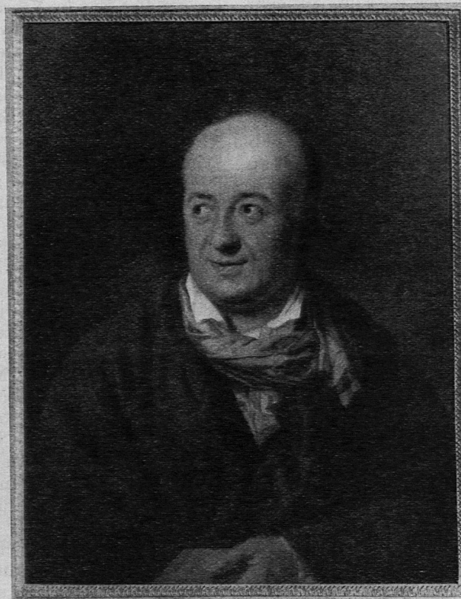
Salomon Geßner 1730–1788