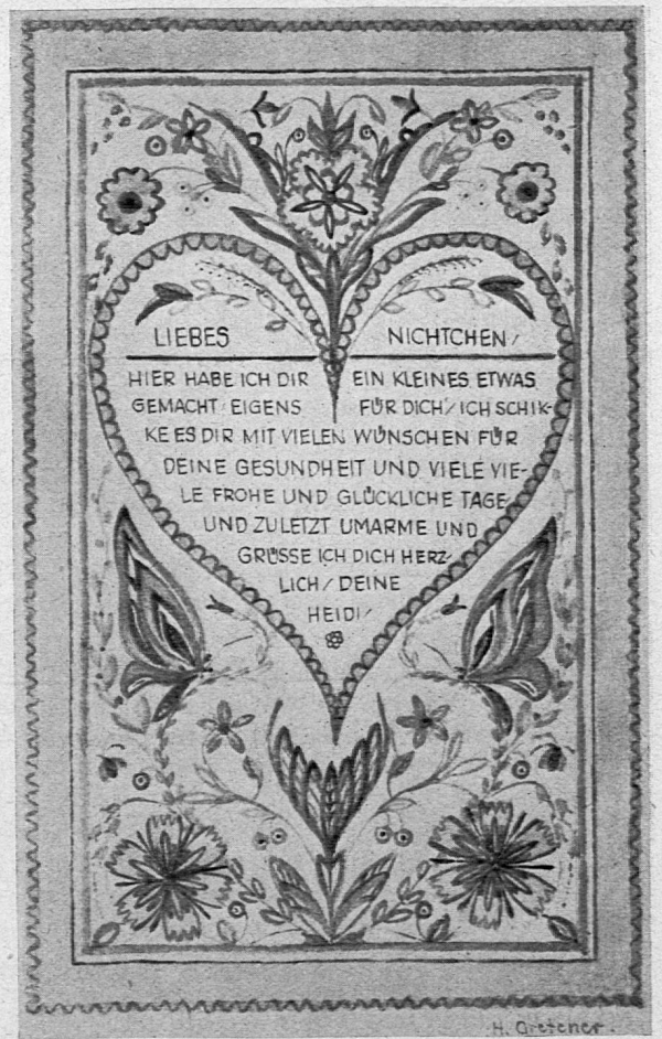
Göttbrief, Original 10×16 cm Schülerarbeit