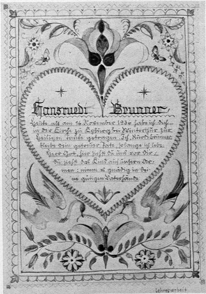
Göttbrief, Original 13×19 cm Lehrer: Rud. Brunner, Winterthur.