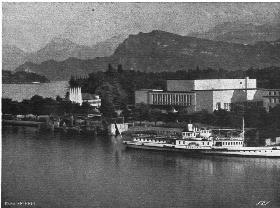
Das Kunst- und Kongresshaus der Stadt Luzern

Il nostro Comitato centrale venne riunito appena tre volte e questo anche per ragione di economia, data la spesa notevole che occorre versare ogni volta per le trasferte.