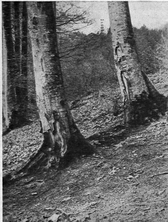
Brandschaden an alten Buchen auf dem Uetliberg. Zum Artikel «Der Wald im Lichtbild» auf Seite 18.

Diese begleitenden Erklärungen unterstützen nicht nur die sachlichen Vorbereitungen des Lehrers, sondern sie bieten auch die wertvolle Möglichkeit zu Schülervorträgen.