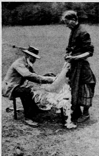
Lötschentaler Ehepaar bei der Schafschur.

Nachfolgend noch einige Mitteilungen über dieses wenig bekannte Sachgebiet: Das Walliser Schaf ist das Schwarznaseschaf, eine eigene Art. Im Winter sind die Tiere im Dorf, in den Ställen, von wo sie bei günstigem Wetter ausgelassen werden, um selbst Futter zu suchen. Die Schweizer Schafzucht im Gebirge leidet an geeigneten Winterweiden. Im Frühling werden die Herbstlämmer geschoren; bis zum Bezug der oberen Alpen werden Schafe und Ziegen gemeinsam gehütet; oft muss jede Familie Hüter stellen, abwechselnd, auf je 10 Schafe 1 Tag.