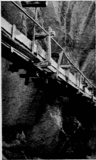
Bisse von Savièse. Kanal und Fußsteg hängen in der Luft. Die Leitung ist undicht, sie tropft.

Das Klima: Ein Lichtbild zeigt Opuntien an den Felsen von Sitten; es ist also (Schülerfolge- rung) sehr heiss. Warum? Südliche Lage des Gebietes, wie das Tessin. Die Regenwolken stossen von Südwest her an Alpenmauer, die Gewitterwolken der Berner Alpen ebenfalls an eine 3500—4000 m hohe Mauer und die Wolken regnen sich ab; was hereinkommt, ist leichtes Gewölk. Skizze des Regenschattens. Die Winde des Wallis sind einfach; man unterscheidet Ost- und Westwind, welche meist abwechseln. Sie wirken trocknend; zudem wird durch die kräftige Besonnung die Luft in die Höhe geführt (Talwinde). Wie ist es nun mit dem Regen?