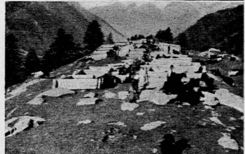
Schafherde bei Guggialp (2100 m ü. M.).

der Lehrer während des Filmablaufs nicht viel erzählt, sondern die ruhige Beobachtung nicht stört; nur hie und da kann ein Zuruf erfolgen (denn der Lehrer hat ja den Film vorher besichtigt), z. B.: Wie wird das Schaf hineinbefördert? Oder: Welche Finger halten den Wollfaden? (beim Spinnen).