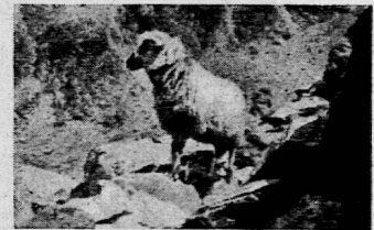
Verwildertes Schaf im Bietschtal.

Nach jedem Abschnitt wird durch Fragen festgestellt, wieviel begriffen worden ist und was die Schüler behalten haben. Am besten ist es, wenn