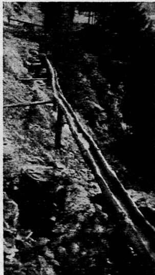
Seitenzweig einer Leitung aus ausgehöhlten Lärchenstämmen.

Im Talboden benützt man heute auch Grundwasser, doch ist das erwärmte Leitungswasser vorzuziehen.