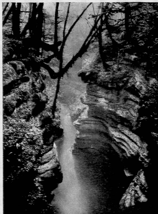
Gorge de l'Areuse