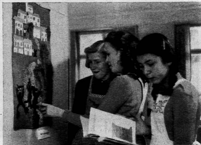
Schülerinnen betrachten eine Arbeit der Klasse Cleis-Vela

Wie sehr das Pestalozzianum als im Dienste der Allgemeinheit stehend empfunden wird, beweist ein Gesuch des Schweizerischen Roten Kreuzes, unser Institut möchte seine Räume für die Bücherausgabe an französische Flüchtlingskinder zur Verfügung stellen. So bescheiden unsere Raumverhältnisse sind: wir haben dem Gesuch entsprochen; und nun holen jeden Donnerstagnachmittag 60—80 solcher Kinder ihre Wochenlektüre im Pestalozzianum ab und beleben mit ihrem französischen Temperament unsere Räume.