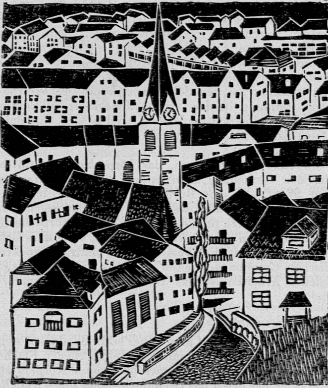
Dächer von Chur, Linolschnitt. 5. Seminarklasse, 17jährig. Format 23/24

gleichen der Formen und Richtungen. Methodisch ist etwa der folgende Weg zu empfehlen: