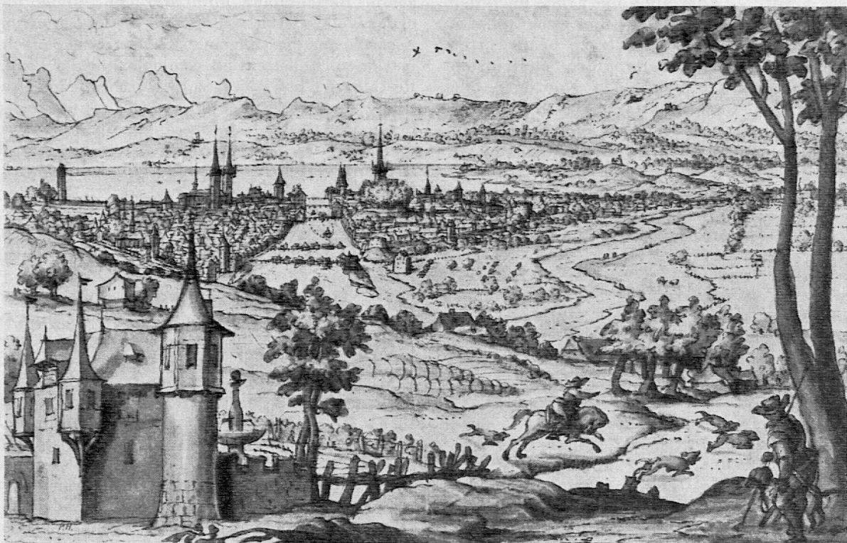
Blick vom Beckenhof auf das alte Zürich. (17. Jahrhundert. Original im Besitze des Landesmuseums)

Mit dem Ausleihdienst stehen die Auskünfte zum Teil in enger Beziehung. Zahlreich sind die Anfragen an unser Personal über geeignetes Bildermaterial oder Literatur zu speziellen Problemen, und wenn auch unsere Angestellten nicht über spezielle pädagogische