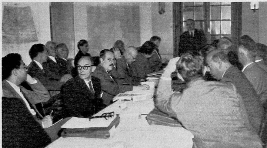
Der Weltkongress für Soziologie und Staatswissenschaften tagt im Beckenhof September 1950