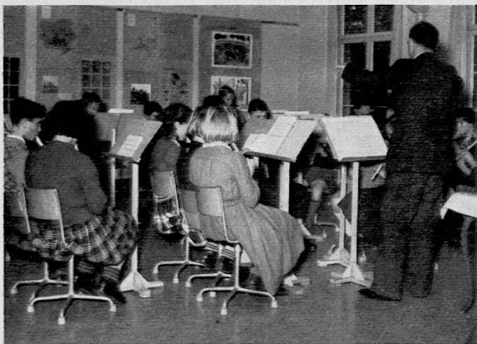
Bei der Eröffnung der Pestalozzi-Kinderdorf-Ausstellung November 1950

resversammlung in Chur gezeigt wurde. — Gegen Jahresende wurden noch vier Kollektionen ausgegeben: eine an das schweizerische Verkehrsbüro in London, das bis zum Herbst 1951 eine Wanderausstellung in England zeigt, eine zweite an das Bureau International d'Education in Genf, eine dritte an die Internationale Jugendbibliothek in München und eine vierte an das indische Erziehungsdepartement. — Auf Einladung hielt der Leiter des Instituts Vorträge an einer von den Regierungen Badens und Württembergs organisierten Studienwoche für musische Erziehung auf der Comburg und in der Internationalen Jugendbibliothek in München. Ferner wurde er vom alliierten Oberkommando Südbadens zur Leitung einer Jury beim Zeichenwettbewerb deutscher und französischer Schulen nach Konstanz berufen.