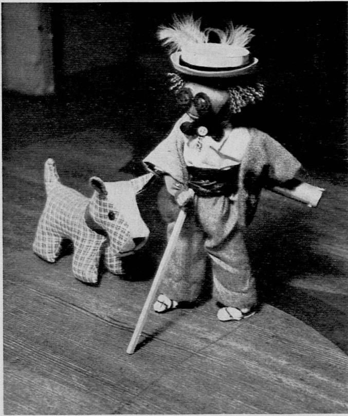
Aus der Ausstellung: Selbstgefertigte Puppen. — Der Herr Botaniker mit Hund auf der Suche nach neuen Pflanzen. Originelle Puppe aus Stoffresten

Ausbildung verfügen, sind sie doch in der Lage, auf Grund langer Erfahrung und gewissenhafter Einarbeitung in unsere Bestände, wertvolle Aufschlüsse zu geben. — Daneben gehen aus dem In- und Auslande Anfragen ein, die nicht ohne weiteres beantwortet werden können, so etwa, wenn wir «die wichtigsten pädagogischen und Erziehungsfachzeitschriften in allen Sprachen und Ländern» nennen sollen! Das geht über unsere Kraft. — Aber auch die Frage nach dem «Stand des Unterrichts in Biologie und Geographie an schweizerischen Schulen» ist schwer zu beantworten, ebenso jene nach der «Handhabung der Schulaufsicht in den Primarschulen der einzelnen Kantone» oder nach dem Stand der Schulmusik in der Schweiz. — Wir sind froh, wenn wir in solchen Fällen auf die Mitarbeit der betreffenden Fachleute zählen dürfen. — Das Interesse des Auslandes an einzelnen schweizerischen Schuleinrichtungen ist gross, und mehr als eine Anfrage ist uns durch schweizerische Konsulate oder durch das Eidg. Departement des Innern oder des Äussern übermittleit worden. Nur schade, dass der Bund die Subvention an die schweizerischen Schulausstellungen vollständig gestrichen hat! Ein Beitrag würde uns die Arbeit erleichtern und wäre durchaus gerechtfertigt.