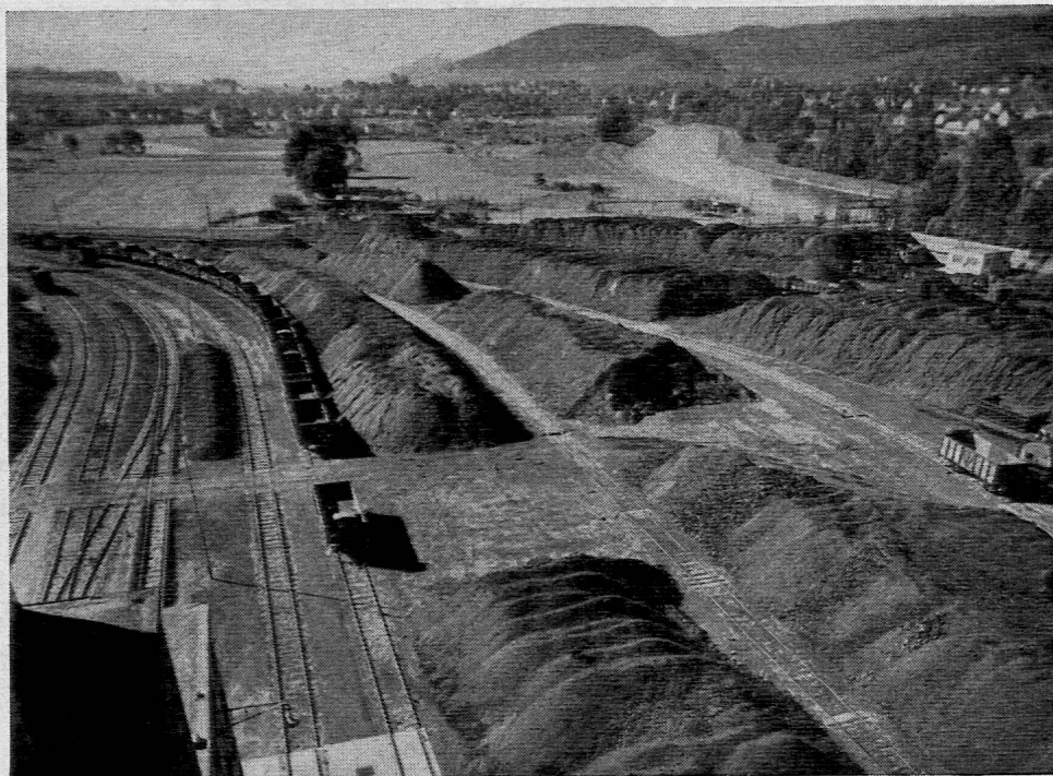
Karl erlebt die abenteuerliche Geschichte der Erfindung des Kochgases, darf nachher an einer Fahrt rheinaufwärts durchs ganze Koh-

Reiche tropische Vegetation bedeckte vor Jahrmillionen weite Gebiete der Erdoberfläche. Ihre Rückstände bildeten mit der Zeit ganze Schichten. Grosse Flächen versanken dann allmählich im Wasser von Seen und Meeren, welche gewaltige Mengen von Sedimenten darüber ablagerten. Unter dem Druck dieser Gesteine verwandelten sich die organischen Rückstände zu Kohle. Diese wird heute durch die Arbeiter der Kohlenbergwerke wieder ans Tageslicht gebracht. Ein Teil der geförderten Kohle wandert in die Gaswerke und wird hier veredelt, d. h. in einzelne Bestandteile (Gas, Koks, Beiprodukte) zerlegt, die dem Menschen weit bessere Dienste leisten, als wenn man die rohe Kohle einfach verbrennen würde.