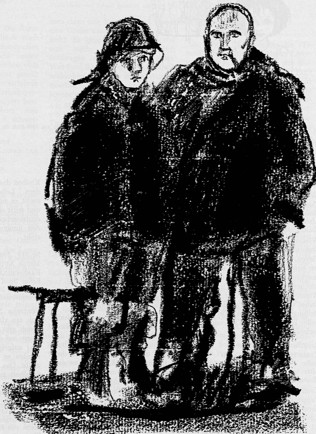
Illustration von Godi Hofmann aus SJW-Heft Nr. 913 «Lars, der Lofotfischer»

wird mit der Herausgabe von 7 Neuerscheinungen und 1 Nachdruck abgeschlossen. Die 48seitigen Hefte «Unsere Gott-hardbahn» und «Wenn sich doch alle Kinder der Welt die Hand reichten...» (Die Geschichte des Roten Kreuzes) sowie das Heft «Gestohlen, verbrannt, verunfallt» (Entstehung und Aufgabe der Versicherungen) geben nicht nur den jugend-lichen Lesern, sondern auch den Eltern aufschlussreiche Hinweise. Die kleinen Mädchen werden sich besonders über das Heft «Eveli und das Wickelkind» freuen; die grösseren Kinder aber werden mit Spannung das Heft «Lars, der Lofotfischer» lesen. Ganz besonders sei auch noch auf das Modellbogenheft «Meine Autofabrik und Fahrschule» sowie auf das neue Heft von Carl Stemmler «Tiere verschlafen den Winter» hingewiesen.