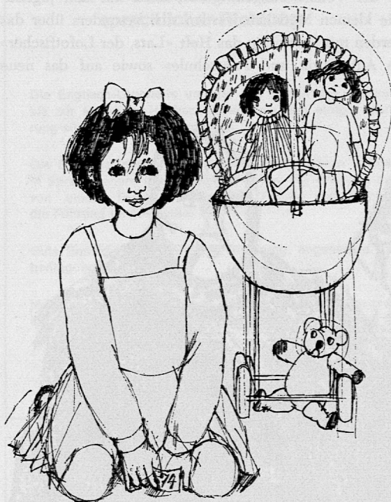
Illustration von Edith Schindler aus SJW-Heft Nr. 912 «Eveli und das Wickelkind»