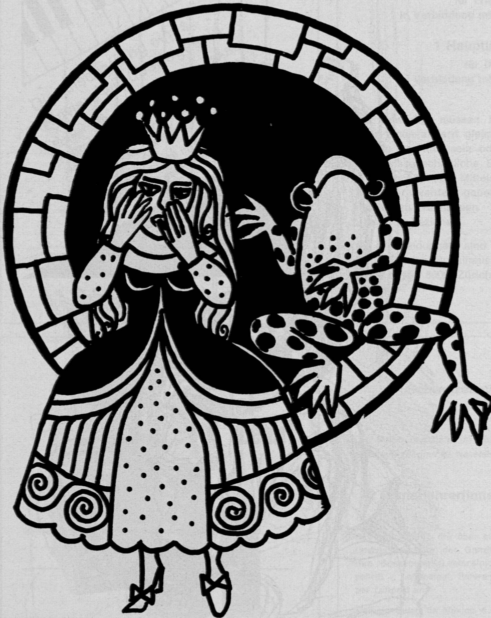
Illustration von Hildi Brunschwyl aus SJW-Heft Nr. 967 «Der Froschkönig»

Es sei noch darauf hingewiesen, dass das beliebte Heft Nr. 556 «Auf Burg Bärenfels» mit neuen Illustrationen erscheint.