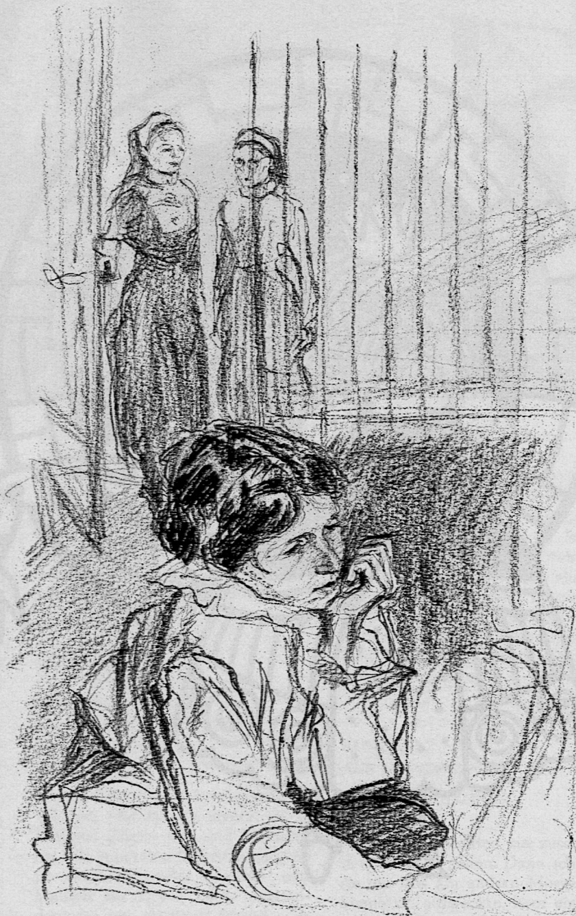
Illustration von Roland Thalmann aus SJW-Heft Nr. 966 «Melis Tierkrankenhaus»