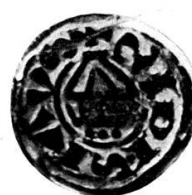
Moulage sans retouche