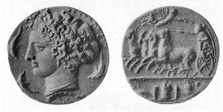
Abb. 2 Dekadr., Syrakus, von Kimon. Kat. A. E. Cahn, 1913

ner am Assinaros, über die zum Andenken ausgegebenen Festprägungen der Dekadrachmen oder Medaillons, wie er sie nach alter Sitte noch nannte, über die im Abschnitt der Vorderseite dargestellten Waffen als Preise im «Kampf der Wagen und Gesänge» usw. – ungefähr so, wie Du es selbst erst kürzlich wieder bei der Beschreibung eines übrigens stempelgleichen Exemplares in einer Schweizer Sammlung dargestellt hast 3 . Mit der zweiteiligen schwarzen Lupe, die er anzuwenden