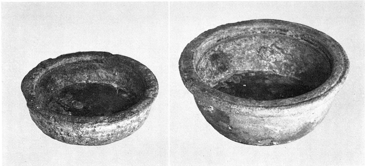
Abb. 4 Die 2 Schälchen von Aventicum

wie 2 : 3, bei einem Einheitsmaß von 25 g, das nicht gut passen will. Ihre Gewichtsdifferenz aber beträgt genau 26,2 g; berücksichtigt man den etwas ausgebrochenen Rand des kleineren Schälchens mit \frac{3}{10} g, knapp 26 g. Dies ist jedoch die Hälfte der gallischen Unze von 51,8 g, nach unserer obenstehenden Berechnung 17 .