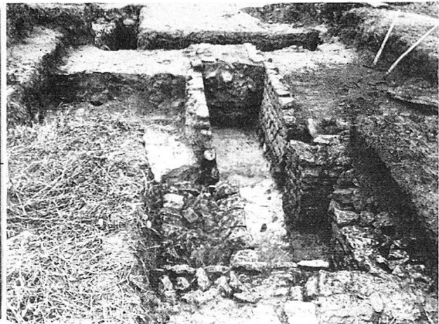
Abb. 2 Die Fundstelle

Zugang zu einer Heizungsanlage (Hypokaust) lagen, eng aneinandergeschichtet, an die hundert Bruchstücke von Statuen, Zierat und Geräten aus Bronze, nebst einigen eisernen Werkzeugen. Anscheinend handelt es sich um das Versteck eines Altwarenhändlers, der nach dem Untergang der Stadt die Ruinen durchstöberte und an dieser verhältnismäßig geschützten Stelle ein Lager anlegte. Über diesen Bronze- stücken stieß man auf eine 50 cm dicke Schicht von Ziegeln und Schutt; das Gebäude war eingestürzt, ehe der Plünderer zurückkommen und die Ware abholen konnte (Abb. 1 und 2). Durch diesen Umstand sind zahlreiche Bruchstücke von Statuen, darunter in wunderbarer Erhaltung die Figur eines göttergleichen Jünglings, auf uns gekommen 8 . Neben solchen Kunstwerken nehmen sich die drei Gewichtssteine und zwei Meßschälchen aus Bronze, die wir hier beschreiben wollen, eher bescheiden aus. Sollten unsere Wahrnehmungen richtig sein, übertreffen sie jedoch an Bedeutung alles übrige und werden einen Ehrenplatz im Museum von Avenches einnehmen.