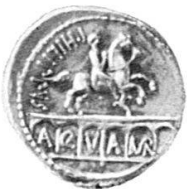
3. Reiterstatue des Q. Marcius Rex , Capitolium. Denar des Marcius Philippus, 56 v. Chr. Inv. 1135, vgl. Jb. Bern. Hist. Mus. 1959 bis 1960, 258, Sydenham CRR 919.