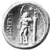
2. Statue des Marsyas , Forum Romanum. Denar des L. Marcius Censorinus, um 84 v. Chr. Inv./Wegeli-Hofer 307. Sydenham CRR 737.