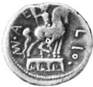
1. Reiterstatue des Mn Aemilius Lepidus , Capitolium. Denar des Mn Aemilius Lepidus, um 109 v. Chr. Inv./Wegeli-Hofer 83. Sydenham CRR 554.

Das Material ist keineswegs vollständig, da das Münzkabinett nur einen Teil der Münzen dieser Gattung enthält. Von verschiedenen Varianten wurde jeweils das besterhaltene Exemplar ausgewählt.