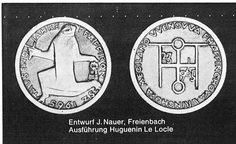
Entwurf J. Nauer, Freienbach Ausführung Huguenin Le Locle