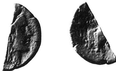
2 Nr. 10, Rregion