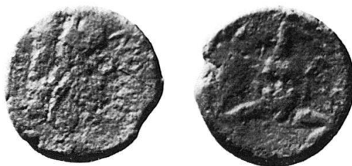
4 Nr. 16, Iaitas