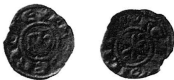
6 Nr. 21, Friedrich II.