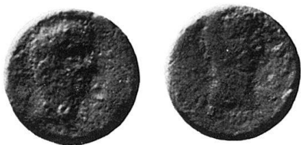
3 Nr. 15, Panormos