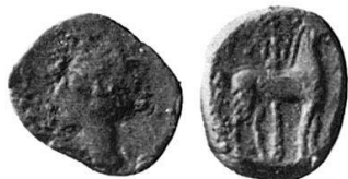
1 Nr. 1, Punisch