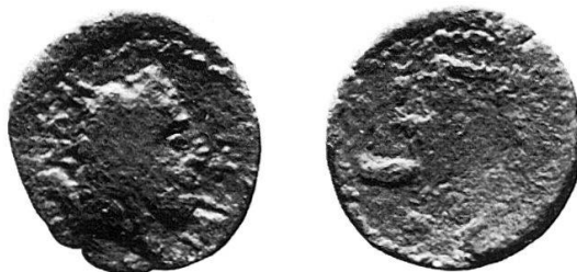
5 Nr. 17, Iaitas