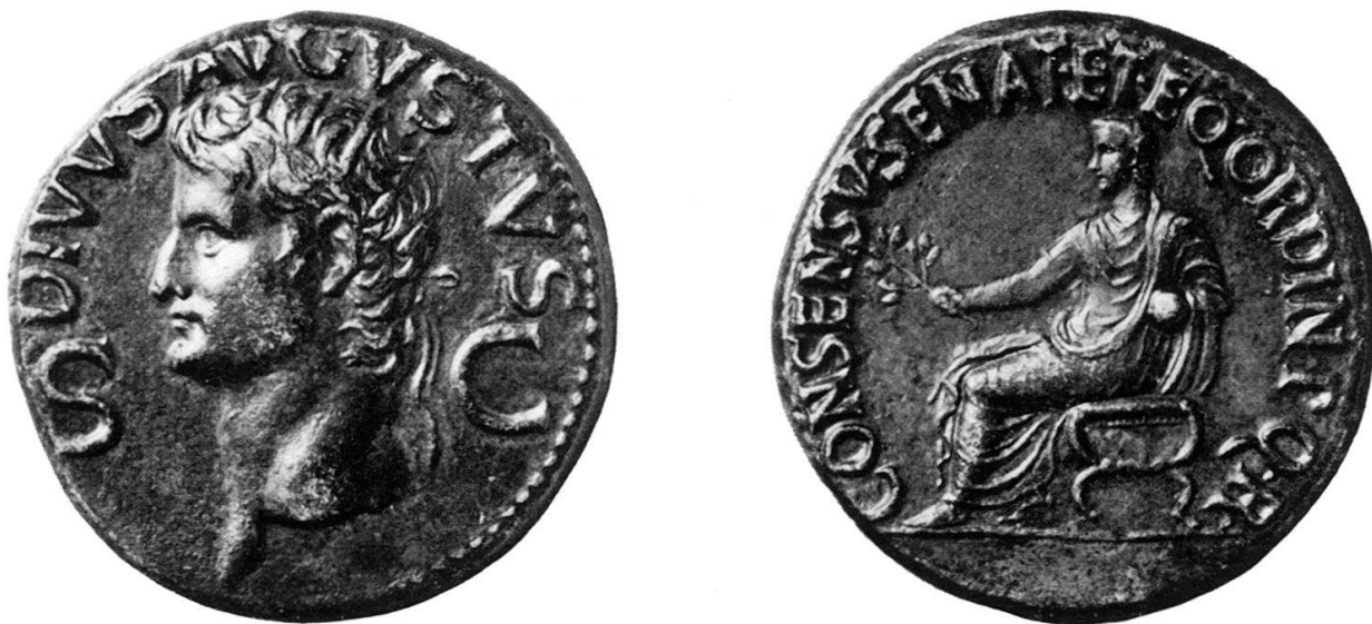
Abb. 6 (2 : 1)

Während man früher, fehlgeleitet durch die Identifizierung der sitzenden Gestalt mit Augustus als selbstverständlich annahm, daß sich die Legende CONSENSV SENAT ET EQ ORDIN P Q R auf den ersten Princeps 24 bezog, ist eine solche Interpretation jetzt nicht mehr plausibel. Die für die Regierungszeit Caligulas zurückgewonnene Prägung findet vielmehr ihre präzise Deutung in den literarisch überlieferten Begebenheiten zu Beginn seiner Herrschaft 25 . Nach dem Ableben des Tiberius am 16. März 37 n. Chr. wurde er in Misenum von den Gardetruppen zum Imperator ausgerufen und Ende März übernahm er in Rom offiziell die kaiserlichen Vollmachten. Dabei soll Caligula, wie Dio Cassius 59, 6 berichtet 26 , vor dem Senat in Anwesenheit von Rittern und Vertretern aus dem Volke eine Rede gehalten haben. Er sprach somit zu den drei Ständen, die in ihrer Gesamtheit das römische Volk repräsentieren 27 . Auch Sueton 28 überliefert, daß Caligula in der