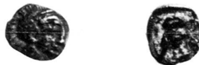
Abb. 3, Maßstab 3 : 1

Die Münze ist ungewöhnlich klein, 0,044 g schwer und sehr gut erhalten. Auf der Vorderseite trägt sie den behelmetten Kopf der Athena nach rechts, auf der Rückseite im Quadratum incusum die nach rechts stehende Eule, mit einem Olivenblatt auf der linken und mit den Buchstaben ΑΘ auf der rechten Seite. Der Stil des behelmetten Athena-Kopfes weist in das frühe 4. Jahrhundert (s. Abb. 3).