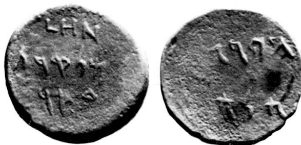
Fig. 2 Tessère de bronze, coll. privée. Photo d'après moulage.

Les caractères sont très proches de ceux qui figurent, au trait, dans l'article précité 2 mais il ne s'agit évidemment pas du même coin sur lequel on aurait ajouté une date. Le bord est bisauté, légèrement, comme dans l'exemplaire décrit par Seyrig, qui en tirait la conclusion que la frappe était antérieure à 126–125 a. C. 3 et suggérait même qu'elle était contemporaine de l'octroi de la consécration et de l'asylie qu'elle mentionne précisément. L'indication d'une année 58 sur la première face ne permet pas de retenir la suggestion en question; nous sommes alors en 84–83 a. C., année de