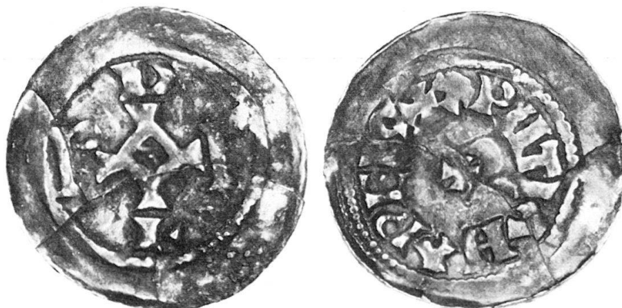
Abb. 1 a (2 : 1)