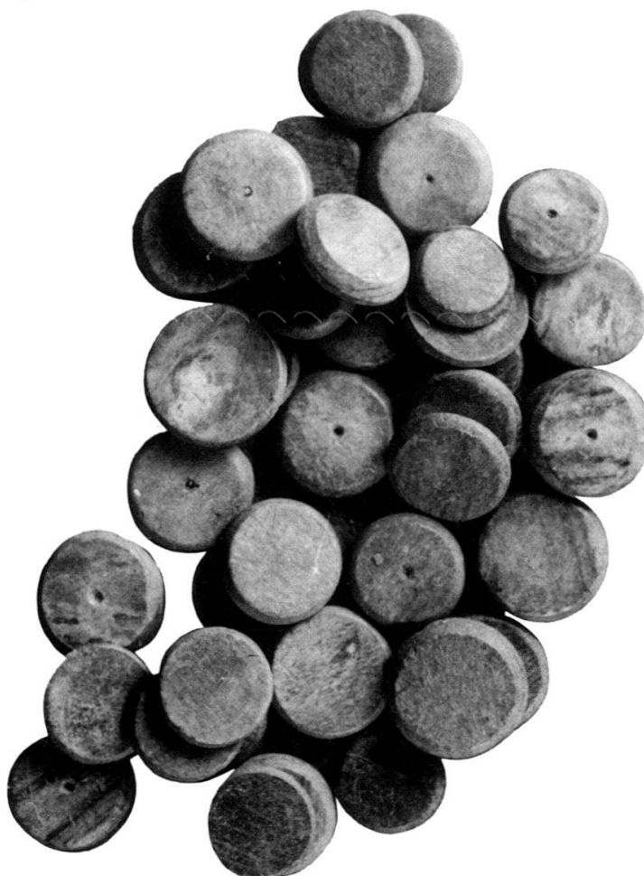
Fig. 1: Assortiment de jeu (jetons et dé).

Il contenait un matériel extrêmement intéressant constitué de 6 monnaies, d'un assortiment de jeu (40 jetons dont 2 portent en graffito le nom de leur propriétaire IUSTUS et 2 dés en os), d'une fibule, d'une petite boîte ronde (peut-être une boîte à cachet), d'une clé, de deux anneaux et d'un instrument métallique (peut-être une balance). 1