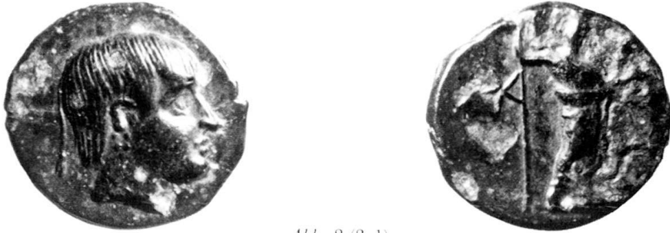
Abb. 2 (3:1)