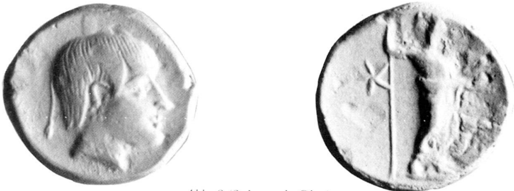
Abb. 3 (3:1; nach Gips)