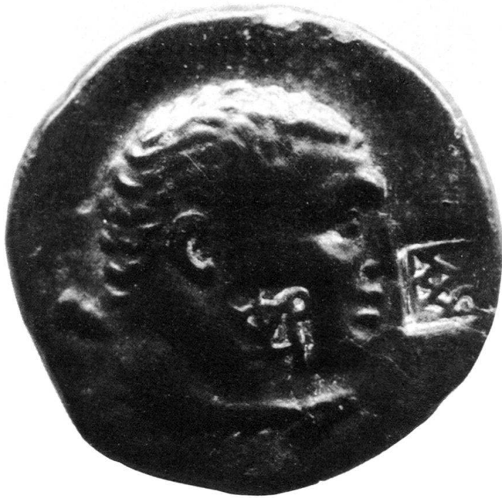
Fig. 4 Contremarques du bronze de Londres (× 3,5)

Dès lors, l'émission des bronzes royaux de Paphlagonie est le plus vraisemblablement antérieure à cette période, confirmant par là les résultats des appréciations stylistique et iconographique 21 .