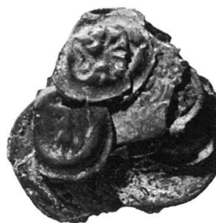
Abb. 1: Zusammengebackene Münzen aus der zweiten Gruppe mit Kupfer-Oxid-Versinterungen (Inv.-Nr. POR 990/492).

Mindestens 600 Münzen weisen starken Kalksinter auf, mindestens 300 andererseits Kupfer-Oxid-Versinterungen. Gesamthaft sind vorerst nur knapp 350 der Münzen sicher bestimmbar: